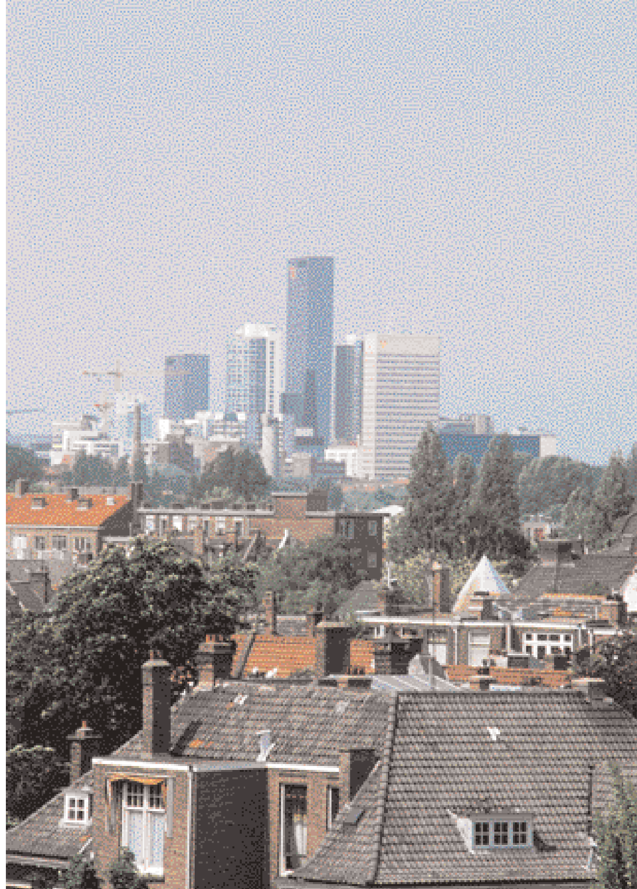
Zicht op Rotterdamse binnenstad

voor de invulling daarvan is een overgang van een toelatingsplanologie naar een ontwikkelingsplanologie zeker van nut. Daarnaast heeft de overheid te maken met burgers en bedrijven die in toenemende mate mobiel zijn. Hierdoor is de grip van ruimtelijke ordening, die immers tot het eigen territorium beperkt is, op de maatschappelijke ontwikkelingen afgenomen. Het nationale ruimtelijk beleid zal de komende jaren met zijn beperkte instrumentarium moeten leren laveren tussen de verschillende waarden die het speelveld van het ruimtelijk beleid markeren, de groeiende institutionele vervlechting in het ruimtelijk veld én burgers die van de overheid een krachtig optreden tegen veiligheidsrisico's wensen.