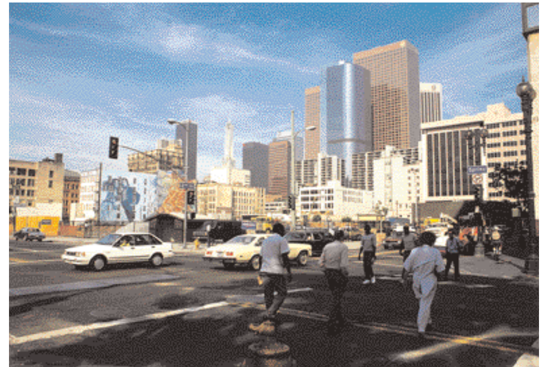
Zicht op Downtown Los Angeles