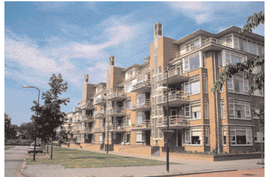
Wonen in jaren 30-stijl, Leidschendam

ordering blijven gekenmerkt door de eerstgenoemde trend, de onderlinge vervlechting van bestuurslagen, al biedt de Nota Ruimte tegelijkertijd een zekere aanleiding tot ontvlechting. Maar aangezien de trends zich in beide richtingen voortzetten, zal de spagaat tussen 'de twee overheden' in de nabije toekomst zeker groter worden. Eenvoudige oplossingen zijn niet voorhanden. Verschillende opties, zoals een sterkere institutionele scheiding tussen beleidsvoering en handhaving, zullen op hun vóór- en nadelen moeten worden getoetst. Een andere te verkennen optie wordt genoemd door de WRR in zijn rapport Het borgen van publiek belang (2000). De Raad stelde dat het niet moest gaan om een ideologisch debat over publiek of privaat, maar om de politieke vraag welke 'publieke belangen' in het geding zijn. Hoe deze belangen moeten worden gerealiseerd, zou meer een kwestie van pragmatiek dan van politiek moeten zijn.