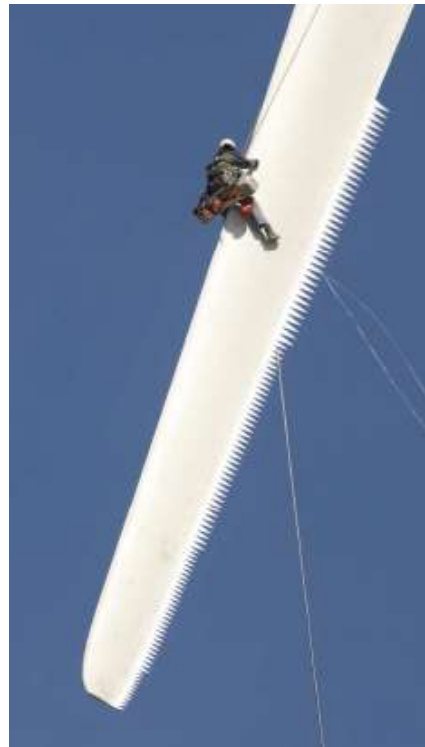
Figuur 2.2: Toepassing van zaagtanden op de wieken van een windturbine ten behoeve van geluidsreductie. 17

Gemeten vlak boven de grond voor de turbine, wieken draaien met de klok mee. De neergaande slag wordt op de grond als het luidste ervaren (rode kleur) omdat de wieken naar voren (in draairichting) het meeste geluid produceren.