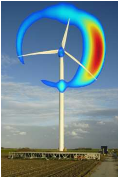
Figuur 2.1: Visualisatie van geluidsbronnen op een windturbine voor een specifieke frequentie. 16

geluidsvoortplantingseffecten bij de planning van een windpark en selectie van de windturbines hiervoor.