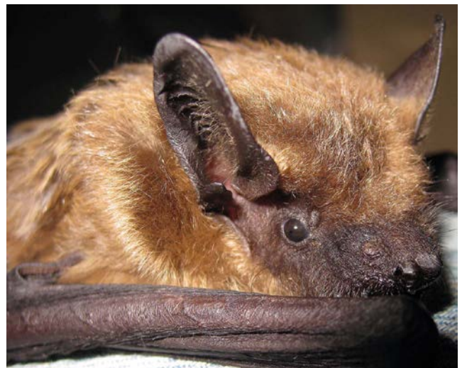
Laatvlieger ( Eptesicus serotinus )

Je kunt een EBLV-infectie alleen oplopen door direct contact met besmette vleermuizen. Daarvoor is een beet, krab of contact met speeksel van een besmette vleermuis met ogen, neus, mond of een open wond(je) nodig. Je kunt dus geen rabiës oplopen wanneer je in dezelfde ruimte of gebouw bent als een vleermuis. Vleermuizen in spouwmuur vormen geen gevaar voor mensen. Wanneer EBLV bij een kolonie van Laatvliegers wordt gevonden, gaat het meestal om één of enkele dieren.