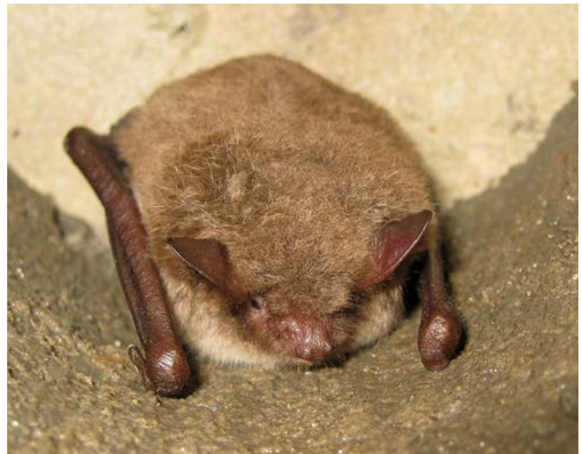
Watervleermuis ( Myotis daubentonii )

Afdeling DSU/Rabiës Houtribweg 39 8221 RA Lelystad