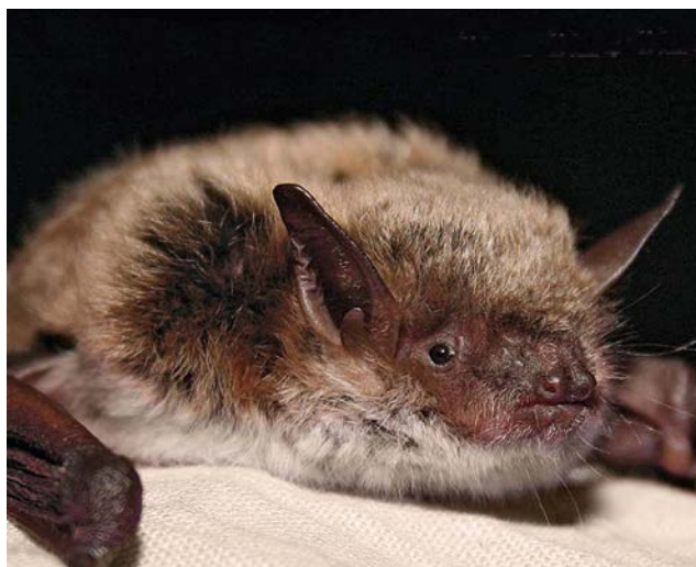
Meervleermuis ( Myotis dasycneme )

Borstel de wond onmiddellijk ten minste 10 minuten grondig met water en zeep. Desinfecteer de wond daarna met jodiumtinctuur of 70% alcohol. Indien dit niet beschikbaar is, gebruik dan gewone huishoudspiritus of een ander desinfectans. Neem hierna meteen contact op met de huisarts of de plaatselijke GGD en ook met de Nederlandse Voedsel- en Warenautoriteit (NVWA) (telefoon 0900-0388 , 24 uur per dag bereikbaar).