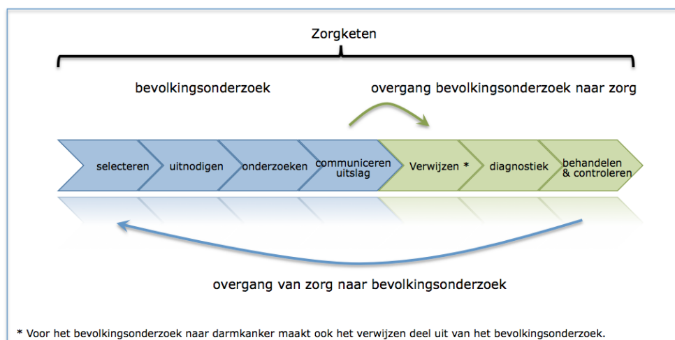
Figuur 1: Weergave van de zorgketen van de bevolkingsonderzoeken naar kanker in stappen van het bevolkingsonderzoek en de aansluitende zorg.

In de onderstaande afbeelding zijn de (algemene) stappen weergegeven die onderdeel uitmaken van de zorgketen met betrekking tot een bevolkingsonderzoek en de aansluitende zorg.