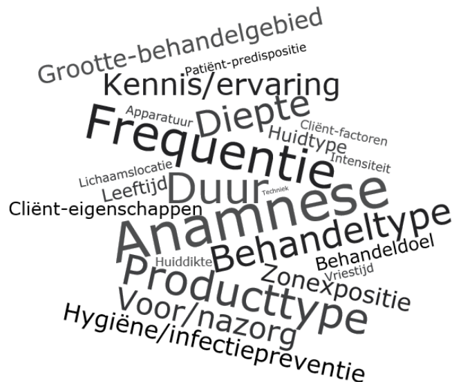
Figuur 2: Word-cloud van factoren die van invloed zijn op het optreden van nadelige effecten. De termen diepte, duur, frequentie, intensiteit en lichaamslocatie slaan op de behandeling.

Voor elk van de bestudeerde risicovolle behandelingen geldt dat er verschillende factoren van invloed kunnen zijn op nadelige effecten. De veldpartijen hebben in het invulformulier voor elk nadelig effect aangegeven om welke factoren het gaat. Een visuele weergave van de genoemde factoren, overkoepelend over alle uitgevraagde behandelingen heen, is weergegeven in Figuur 2.