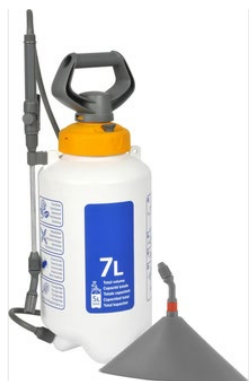
Figuur 3 Drukspuit met onkruidkap.

schoonmaakazijn met 9% azijnzuur in grote volumes aangeboden, maar ook azijnzuur in concentraties van 20 en 80%. Er worden ook combinatiepakketten aangeboden van jerrycans met azijnzuur en een drukspuit, al dan niet met onkruidkap (zie Figuur 3).