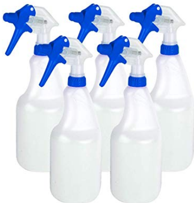
Figuur 2 Spuitflacons of triggersprays

De toegelaten gewasbeschermingsmiddelen voor particulieren zijn 'ready-to-use' oplossingen met 6% azijnzuur. De kant-en-klare producten zitten in een spuitflacon ('triggerspray'; zie Figuur 2). De dosering is 0,1 liter vloeistof per vierkante meter, dit komt overeen met 6 gram azijnzuur per m 2 . Bij pleksgewijze toepassing wordt aangenomen dat 10% van het oppervlak wordt behandeld en wordt daarom gerekend met een 10 maal lagere dosering (0,6 g/m 2 ). Oppervlakten mogen maximaal 4-6 keer per jaar worden behandeld waarbij er 14 dagen tijd moet zitten tussen de behandelingen.