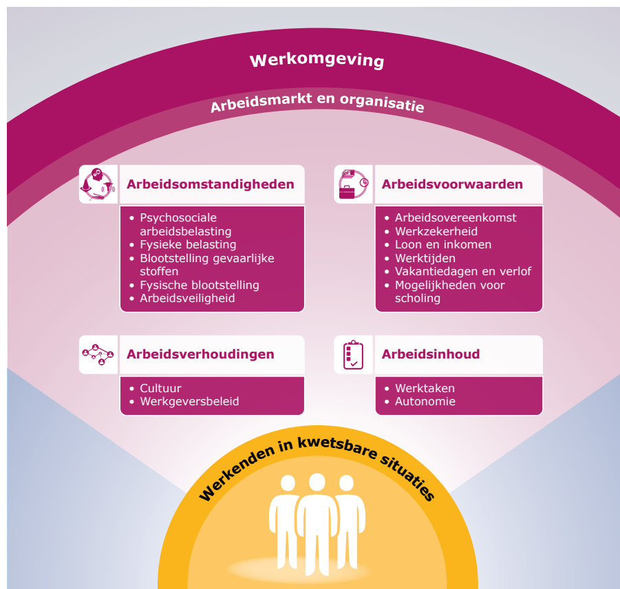
Figuur 2. Determinanten voor kwaliteit van werk binnen het domein werkomgeving

arbeidsverhoudingen en arbeidsinhoud. De laag 'arbeidsmarkt en organisatie' bevat determinanten die te maken hebben met de verhoudingen op de arbeidsmarkt (vraag en aanbod van arbeidskrachten) en determinanten die iets zeggen over de organisatie zelf (organisatiekenmerken). Tot organisatiekenmerken behoren de omvang van de organisatie, de financiële gezondheid van de organisatie en concurrentie. Een ander kenmerk is de positie van een bedrijf in de keten. Dat is het volledige proces om één product of dienst van de grondstoffen tot aan de eindgebruiker te brengen waarbij verschillende bedrijven of zzp'ers opeenvolgend of gelijktijdig samenwerken.