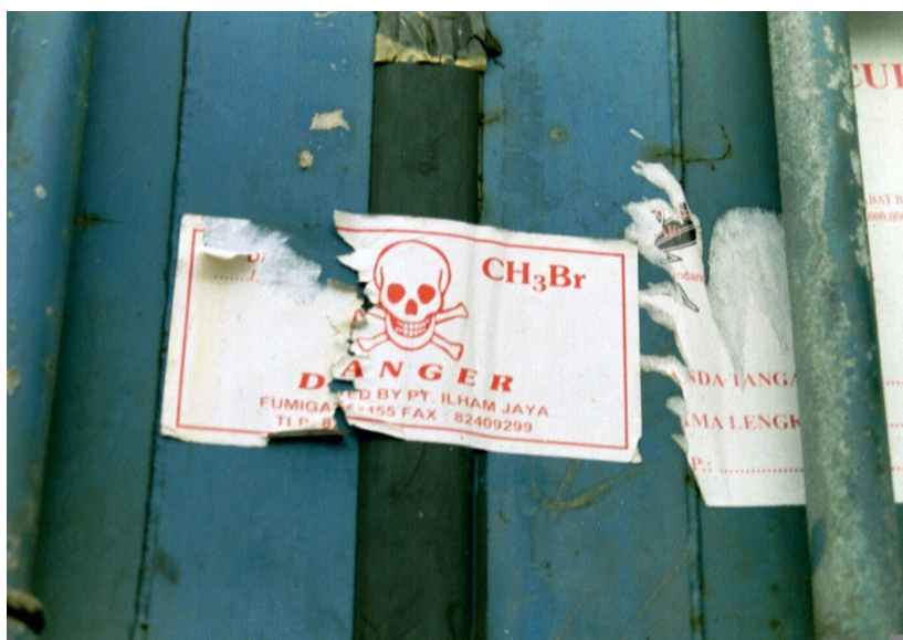
Figuur 1 Waarschuwingstekens op een gegaste container

Internationaal mogen containers waar nog bestrijdingsmiddel in zit, wel worden verscheept. De containers behoren dan waarschuwingstickers te hebben en begeleidende documenten waaruit de gassing blijkt. In de praktijk blijkt maar 2% van de containers van dergelijke stickers te zijn voorzien (Knol-de Vos, 2003). De strikte regels die in Nederland voor gassing van exportcontainers gelden, zijn niet van toepassing op importcontainers waarin bestrijdingsmiddelen blijken te zitten.