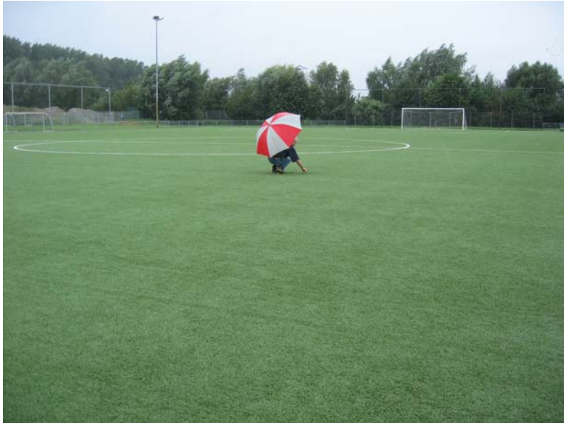
Foto 1 Bemonstering van het materiaal