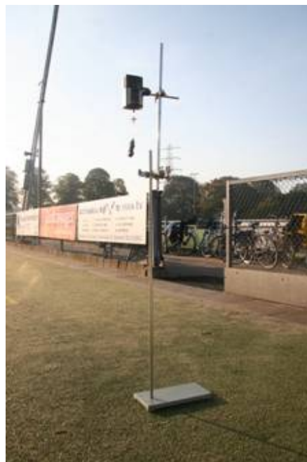
Foto 4 Bovenwindse bemonstering