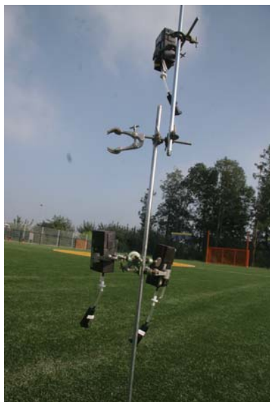
Foto 8 Johan Cruijff Court