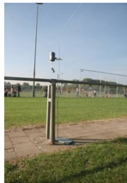
Foto 5 Bovenwindse bemonstering