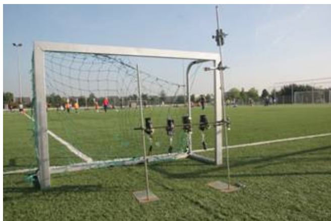
Foto 6 Vijf pompen op Rijkerswoerd