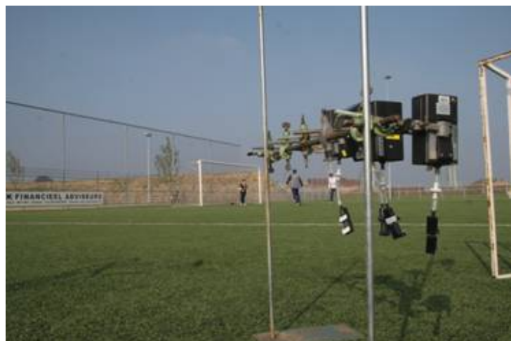
Foto 7 Hoofdveld Bakenhof