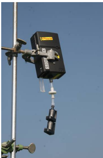
Foto 2 Pompje met daarop aangesloten een stoffiltertje en twee ThermoSorb-N-buisjes