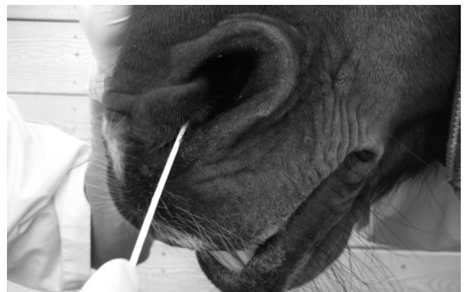
Afnemen neusswab bij een paard