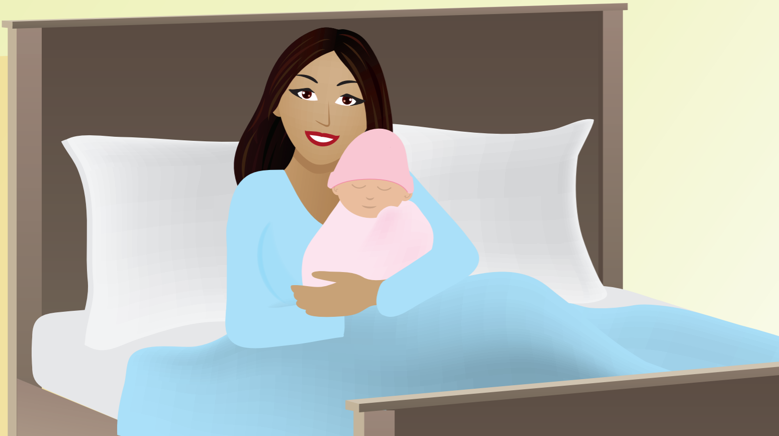
De baby is bijna een week