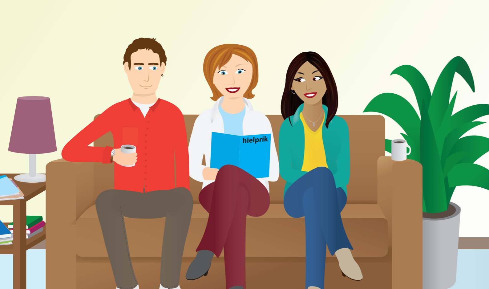
De mevrouw vertelt over de hielprík