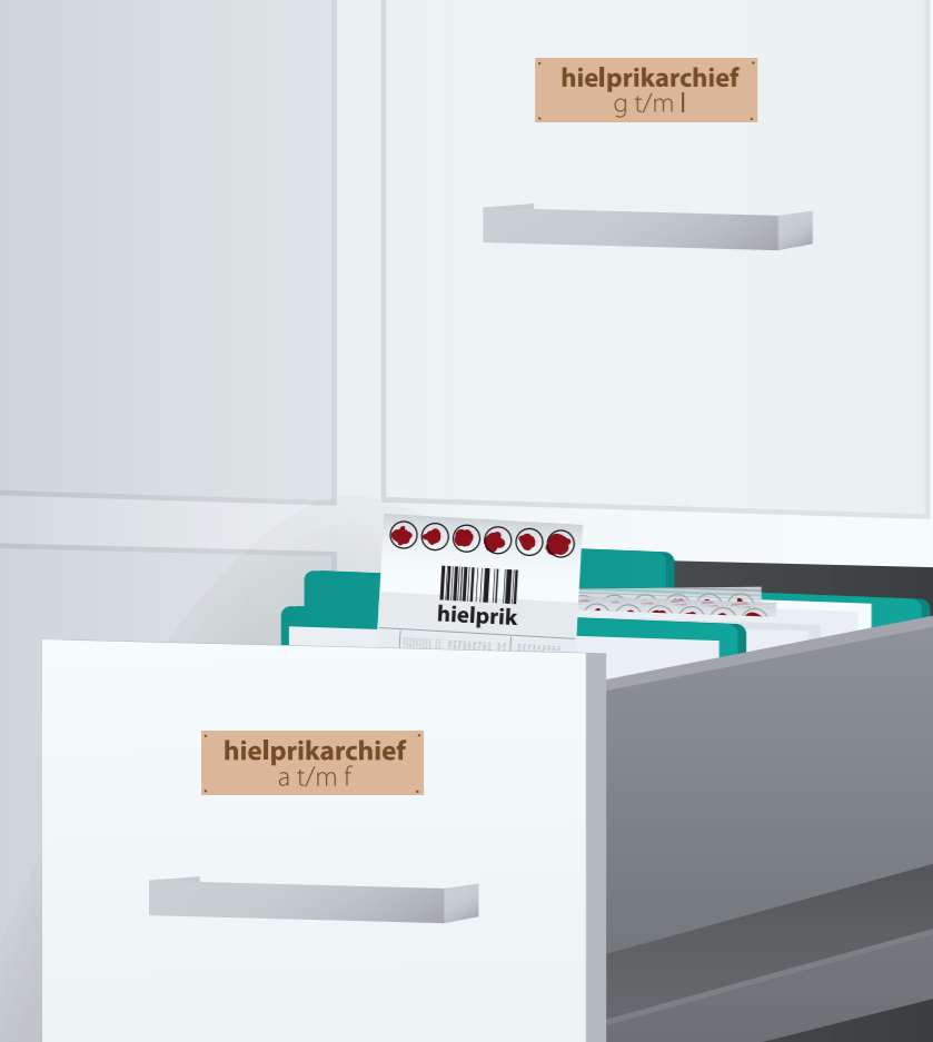
Het kaartje van de hielprik in de kast