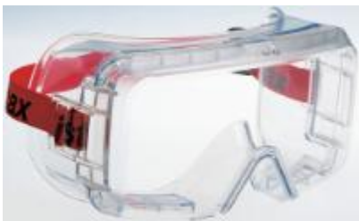
GOGLE VISTAMAX 2000 VX2031 /PULSAFE 1 * 1 SZT

Ideaal voor industriële of petrochemische omgevingen, of laboratoriumomgevingen waarin sprake is van dampen, sprays of toepassingen die gepaard gaan met hitte, vocht of fysieke inspanning. Met verstelbare hoofdband in rood.