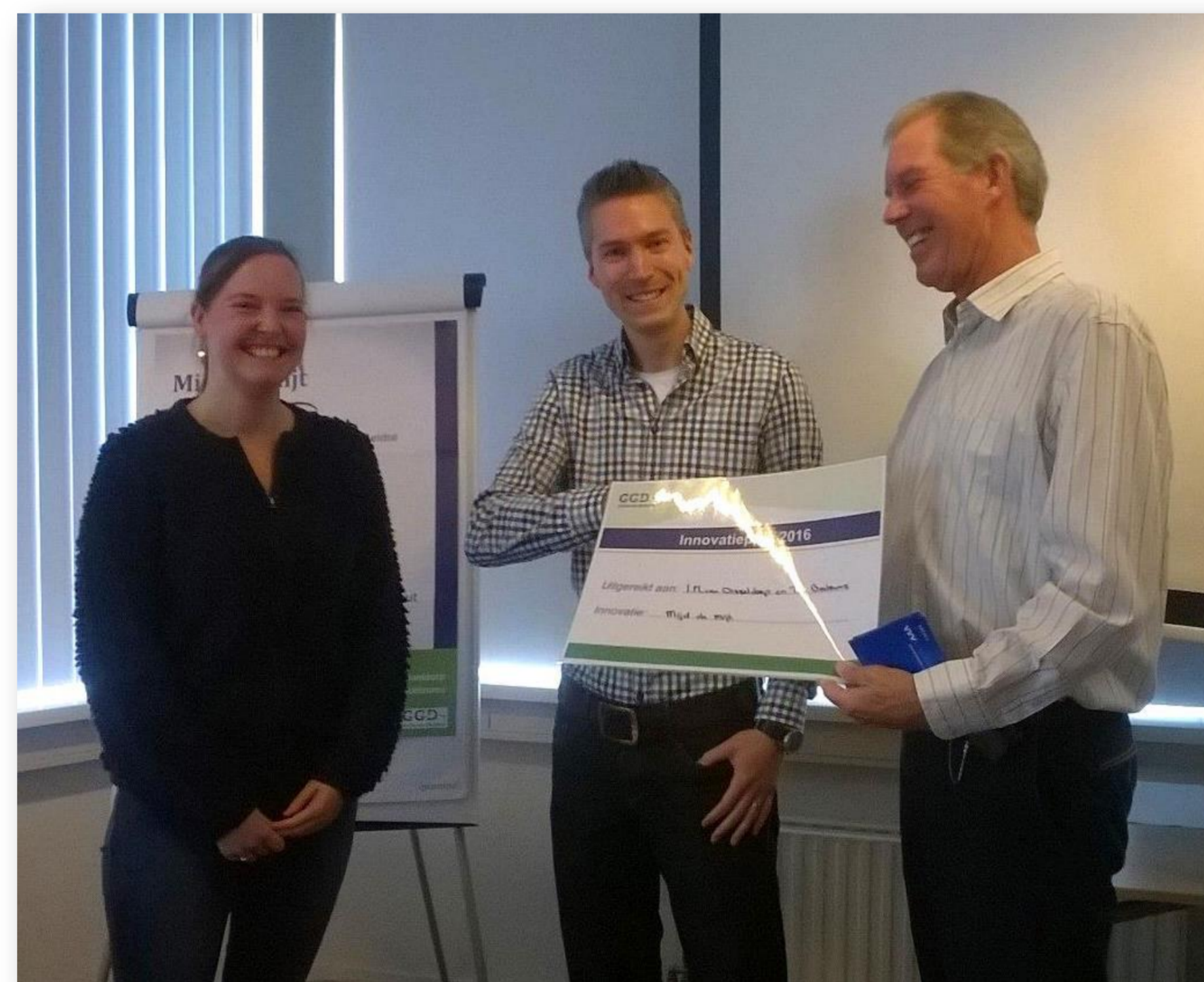
Foto: financiering project door winnen 'AGZ innovatieprijs 2016'