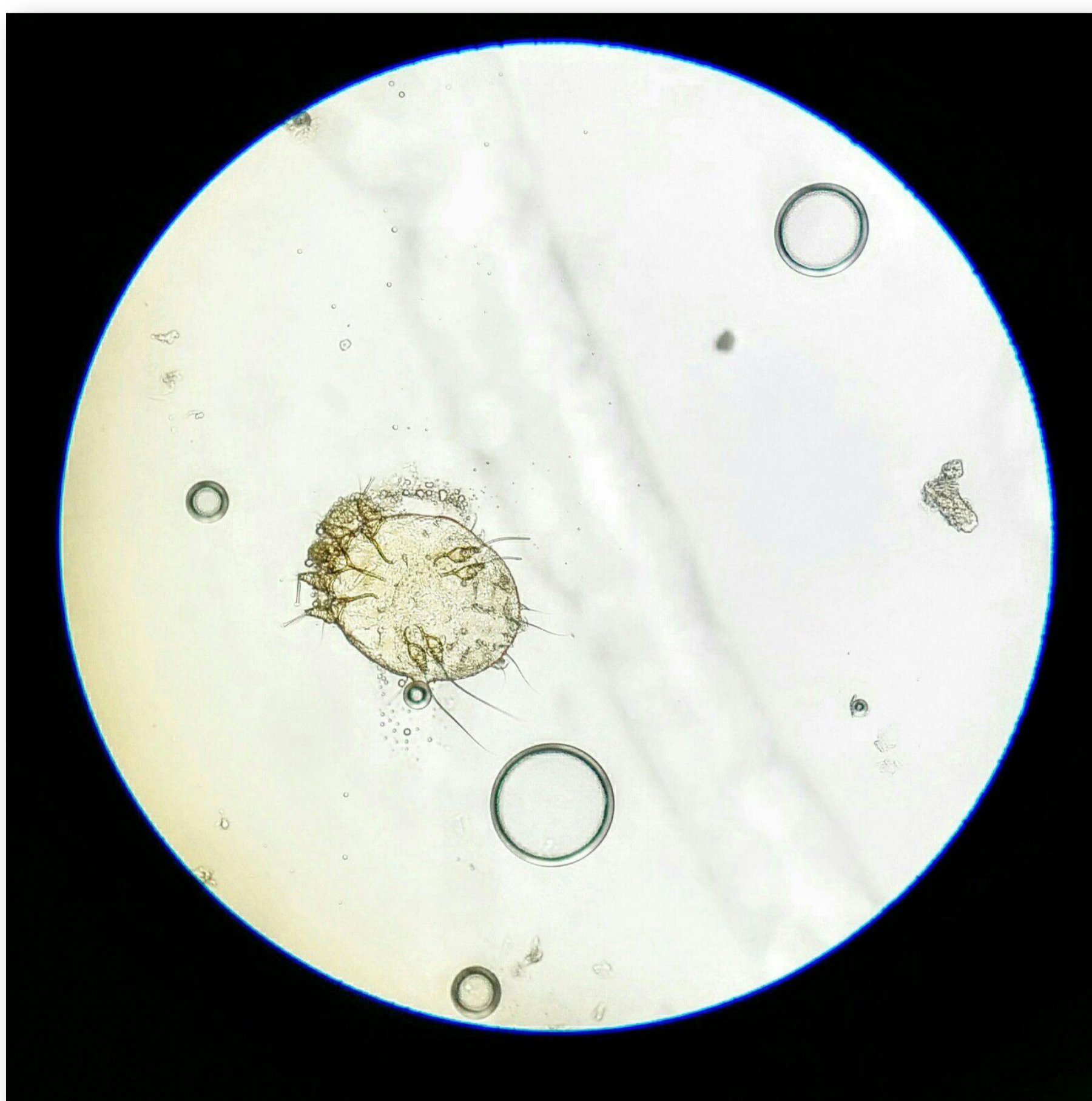
Foto: eerste gevonden scabiësmijt tijdens spreekuur