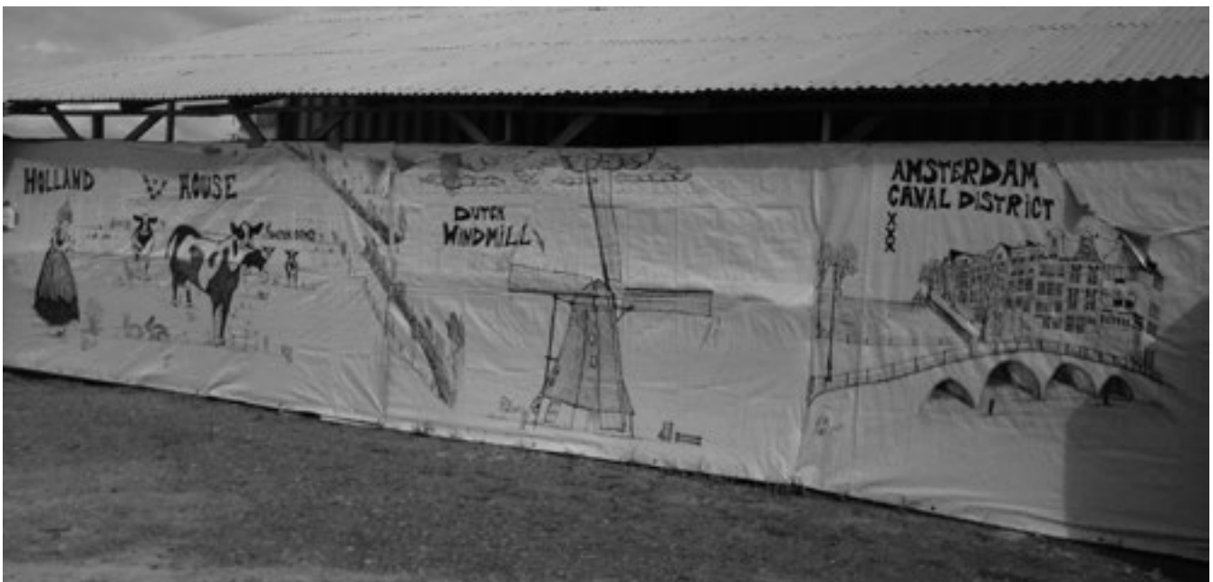
Foto 1 Nederlands mobiele laboratorium in Koidu, Kono

Het mobiele laboratorium in Koidu was operationeel van 13 januari tot 8 augustus 2015. Tot 15 juli 2015 zijn 2726 monsters succesvol geanalyseerd op aanwezigheid van ebolavirus en 799 monsters op malaria. In 34 monsters afkomstig van 28 patiënten werd de aanwezigheid van ebolavirus vastgesteld, in 217 monsters van 143 patiënten malaria. In de laatste 2 maanden zijn in het laboratorium ook lokale trainees opgeleid voor het veilig en accuraat uitvoeren van ebolavirus- en malariadiagnostiek. In totaal zijn er 8 teams uitgezonden naar dit laboratorium. Het is gesloten omdat de financiering niet gecontinueerd werd. Het laboratorium is overgenomen door Public Health England en verplaatst naar Kenema ter ondersteuning van lokale laboratorium activiteiten aldaar.