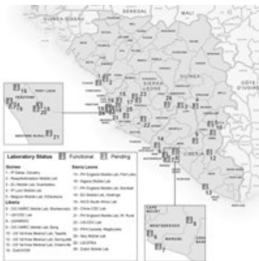
Figuur 1 Kaart van Guinee, Liberia en Sierra Leone met overzicht van 26 internationale operationele laboratoria. Het 27e laboratorium was het 3e Nederlandse mobiele laboratorium en werd op 16 februari 2015 operationeel in Freetown.

Ebola kan eenvoudig worden bestreden door geïnfecteerde personen zo vroeg mogelijk na het ontstaan van symptomen te isoleren (streven Wereldgezondheidsorganisatie (WHO) binnen 2 dagen) en de contacten van deze personen gedurende 3 weken te volgen (incubatie tijd 2-21 dagen) en bij het ontstaan van symptomen eveneens te isoleren (streven WHO: alle nieuwe patiënten zijn bekende contacten zodat er geen onbekende transmissieketens meer zijn). (3) Snelle en betrouwbare laboratoriumdiagnostiek is hiervoor essentieel. Een belangrijke pijler in de internationale respons was dan ook het opzetten van lokale ebolaviruslaboratoriumcapaciteit. In februari 2015 waren er 27 internationale laboratoria actief in de 3 landen (Figuur 1) waaronder 3 mobiele laboratoria gefinancierd door de Nederlandse overheid en mede opgezet door de afdeling Viroscience van het ErasmusMC. (1)