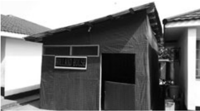
Foto 3 De derde labcontainer op zijn plek met en zonder ombouw in Freetown, Sierra Leone

6-7 maanden is een virus met hetzelfde signatuur niet gezien. Dit is niet geheel onverwachts omdat het aantal patiënten waarvan het volledige ebolavirusgenoom bepaald is, een fractie is van de meer dan 27.000 ebolaviruspatiënten. Het laat echter wel zien dat het bepalen van volledige ebolavirusgenoomsequenties gebruikt kan worden voor het traceren van transmissieketens.