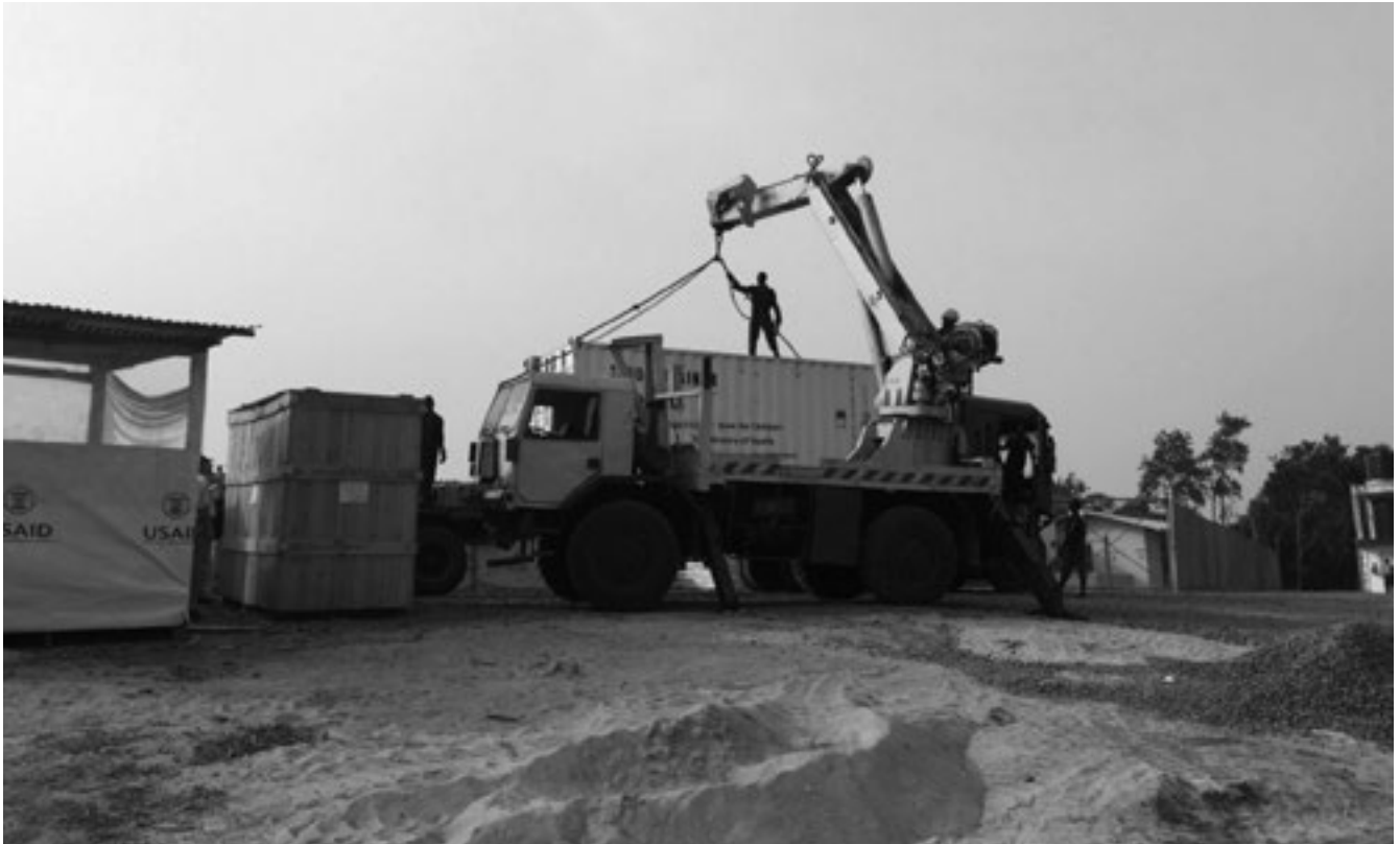
Foto 2 Aankomst van de labcontainer in Sinje, Liberia

Het mobiele laboriorium in Sinje was operationeel van 30 januari tot 17 maart 2015 met inzet van 3 teams. Het werd gesloten vanwege een gebrek aan vrijwilligers als gevolg van de snelle afname van ebolapatiënten Liberia. Gedurende de operationele periode zijn 185 monsters succesvol geanalyseerd op ebolavirus en 68 monsters op malaria. In monsters van 2 patiënten werd de aanwezigheid van ebolavirus vastgesteld; malaria in 17 monsters afkomstig van 13 patiënten. Het laboratorium werd overgedragen aan het ministerie van Volksgezondheid van Liberia, dat met hulp van de Centers for disease Control and Prevention (CDC) een aantal permanente laboratoria inricht, waar dit mobiele laboratorium in wordt opgenomen.