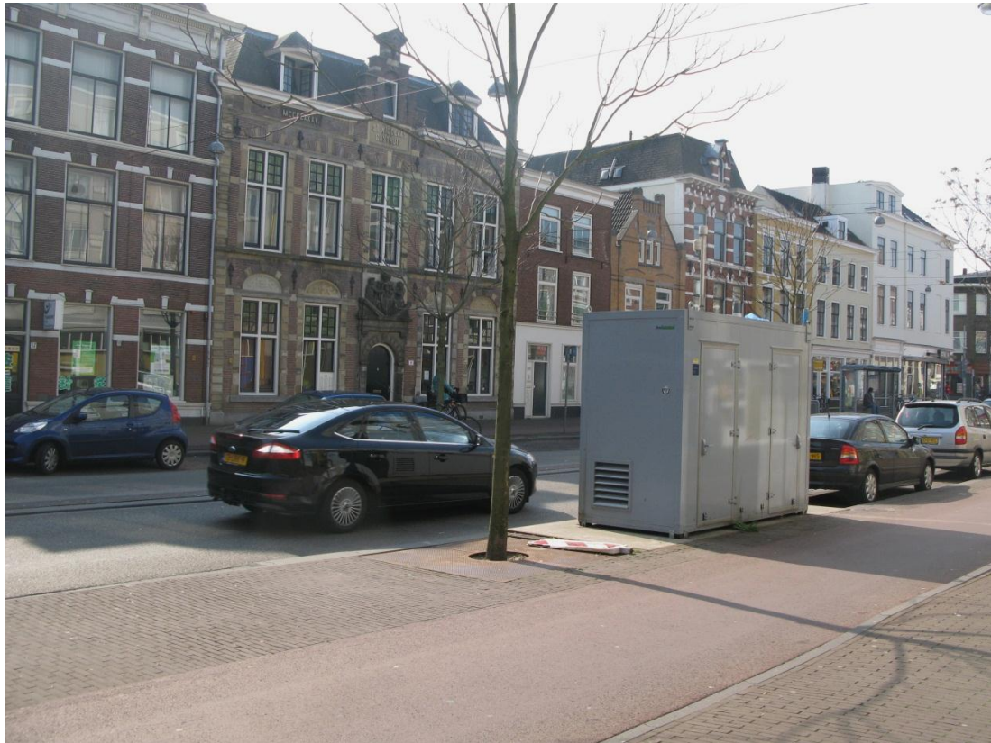
Afbeelding 7. 1 Meetstation Amsterdamse Veerkade in Den Haag. Meetstations spelen een belangrijke rol om te controleren of de luchtkwaliteit voldoet aan de regelgeving.