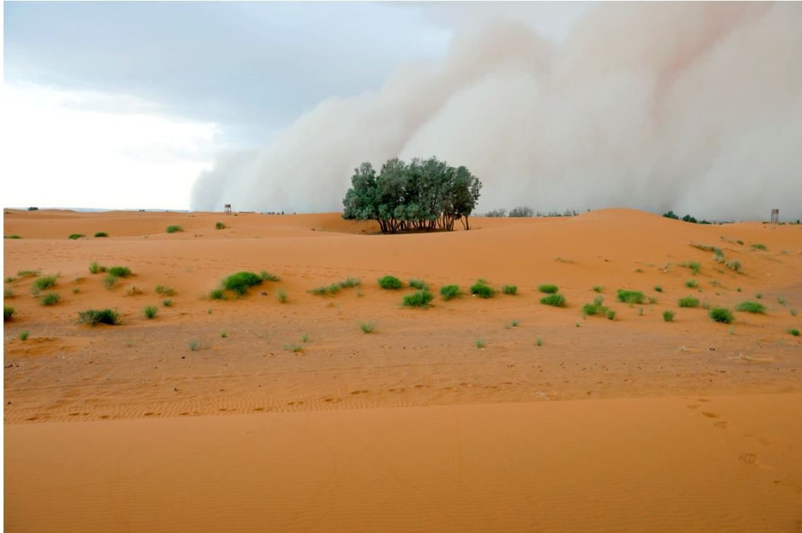
Afbeelding 7.3 Stofstormen in Noord-Afrika kunnen soms een substantiële bijdrage aan de fijnstofniveaus in Zuid-Europese landen leveren. Zeer incidenteel bereikt stof uit Noord-Afrika ook Nederland.