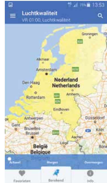
Screenshot app 'Mijn Luchtkwaliteit'

De gemeten data kunnen gratis naar de eerder genoemde sites data.sparkfun.com en dweet.io (of een van de andere mogelijkheden) worden gestuurd en daar met anderen worden gedeeld.