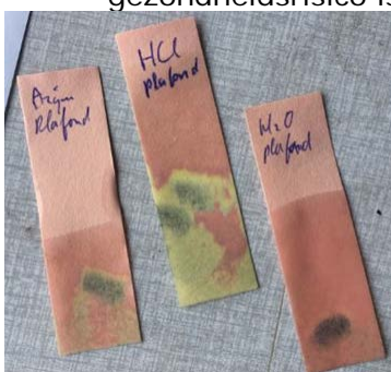
Afbeelding 3: Het aanzuren van fluoride testpapier heeft invloed op de gevoeligheid. Drie metingen op dezelfde plaats in de brandruimte: Links met azijnzuur, midden met zoutzuur, rechts met water.