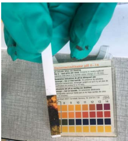
Afbeelding 8: Zwarte depositie maakt het onmogelijk pH papier af te lezen aan de zijde die in contact is gebracht met depositie.

Ph papier kan met bovenstaand punt toegepast worden als indicator voor de mate van besmetting van bijvoorbeeld ingezet brandweerpersoneel of materieel.