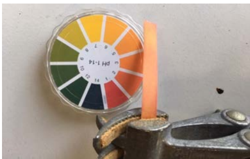
Afbeelding 10: In de rook verkleurt pH papier naar een lage pH (tussen pH 2-5).