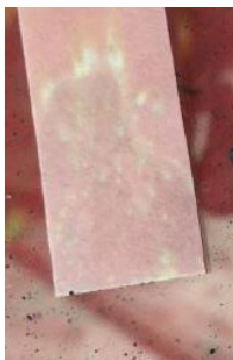
Afbeelding 5: Lage concentraties Fluoride ionen in depositie geven kringvormige vlekken.