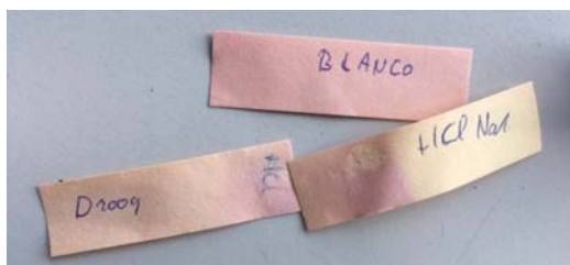
Afbeelding 7: Twee strookjes fluoride papier blootgesteld aan dezelfde rook en beiden met zoutzuur bevochtigd. Het linker papier was voor de proef opgedroogd en het rechter papier was nog nat tijdens de proef.