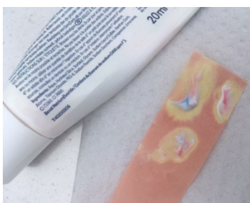
Afbeelding 4: Tandpasta met 1450 ppm Fluoride verkleurt fluoride testpapier ook.