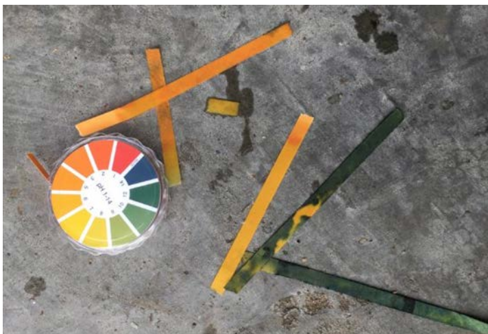
Afbeelding 9: pH papier dat dubbelzijdig af te lezen is blijkt praktischer. Het pH papier dat op de vloer gemeten heeft duidt met groen-blauw op een hoge pH (+/- pH 13). Het pH papier dat op het plafond gemeten heeft duidt met oranje op een lage pH (+/- pH3)