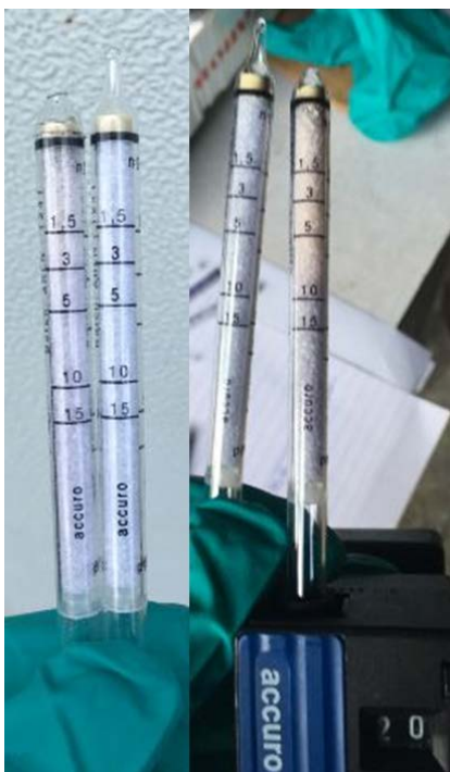
Afbeelding2: Linker gebruikt buisje heeft gemeten in concentraties van 2-3 ppm. Het rechter gebruikte buisje is gebruikt in concentraties van 9- 14 ppm.