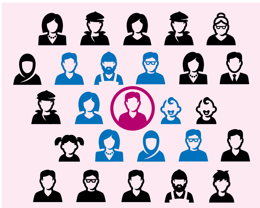
Rysunek 1. Badanie źródła i kontaktu