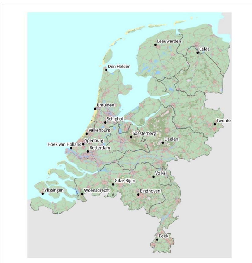
Figuur 2.1 Meteostations in Nederland