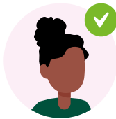
Xir timaha dhaadheer