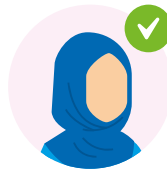
Ma ahan inaad iska bixiso xijaabka