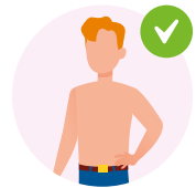
Caadiyan iska bixi marada dhexda