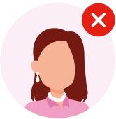
Iska saar dahab kasta oo xiran tahay